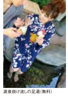
源泉掛け流しの足湯(無料)

薬師公園ポケットパークには、源泉が岩から湧き出す城崎温泉元湯と源泉掛け流しの足湯があります。日常の喧騒を忘れ、憩いのひと時を過ごすことが出来ます。