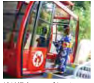
城崎温泉 ロープウェイ 【運行】上り(始:9:10 終:16:30) 時間 下り(始:9:30 終:17:10)