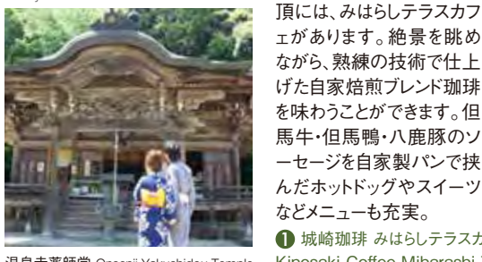
温泉寺薬師堂 Onsenji Yakushidou Temple

湯治客の守護「温泉寺」 古来より、城崎温泉の湯治客が必ずお参りするとされる温泉寺。Onsen-ji Temple is the temple where visitors to the Kinosaki Hot Spring have always visited since ancient times.